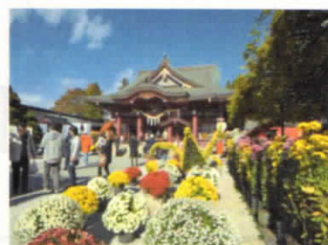
10・11月 笠間の菊まつり