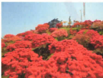
4・5月 笠間つつじまつり